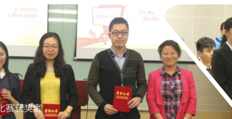
英语演讲比赛获奖者